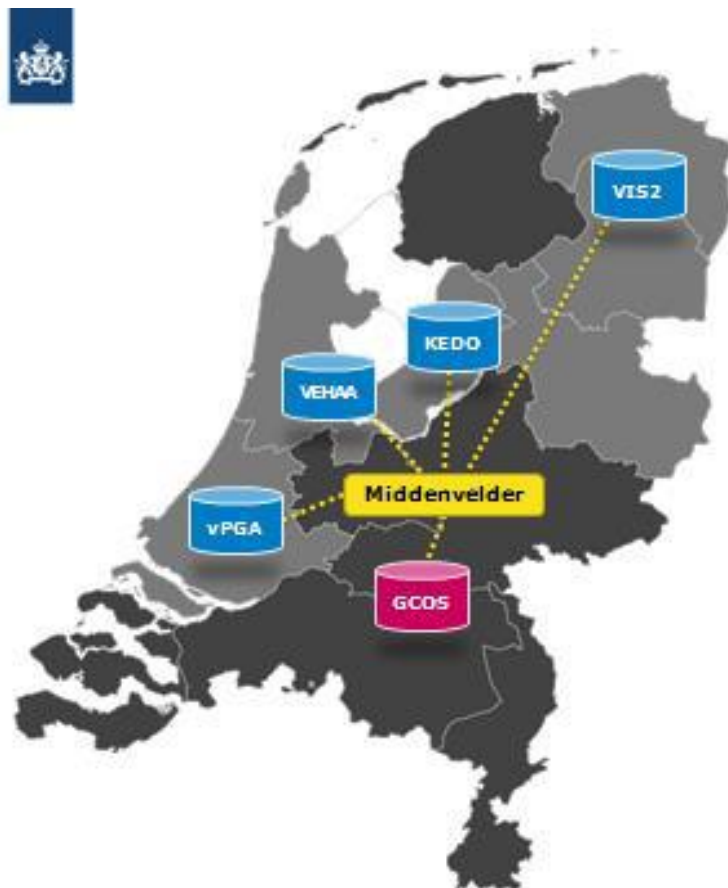
Figuur 1: Werking Middenvelder

De Middenvelder faciliteert samenwerking tussen de verschillende ZVH's, door te voorzien in gestandaardiseerd berichtenverkeer via een verbinding tussen de diverse casusoverlegsysteem van de ZVH's, zoals afgebeeld in figuur 1 en uitgewerkt in tabel 1.